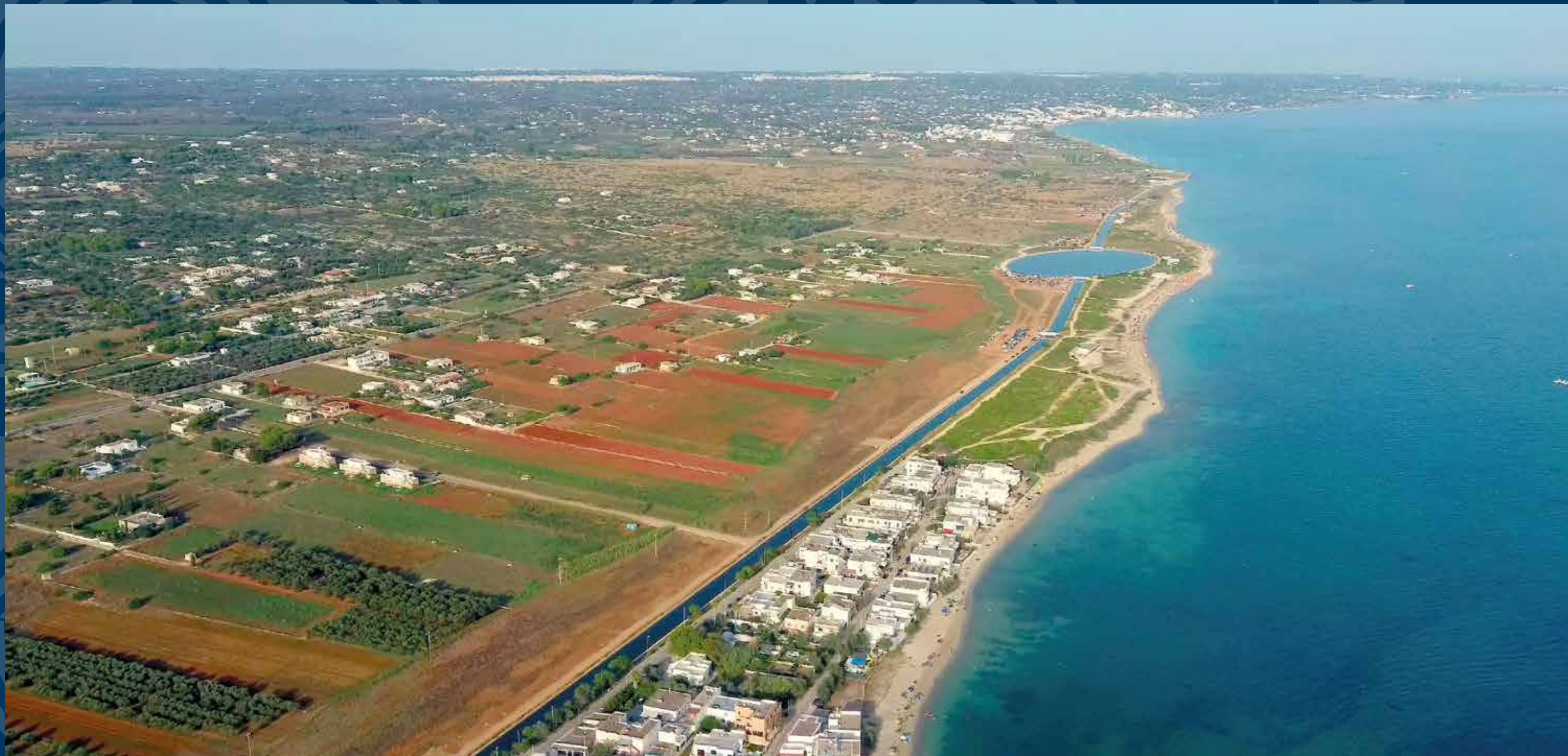
Panoramica aerea di un tratto di costa delle marine di Salve