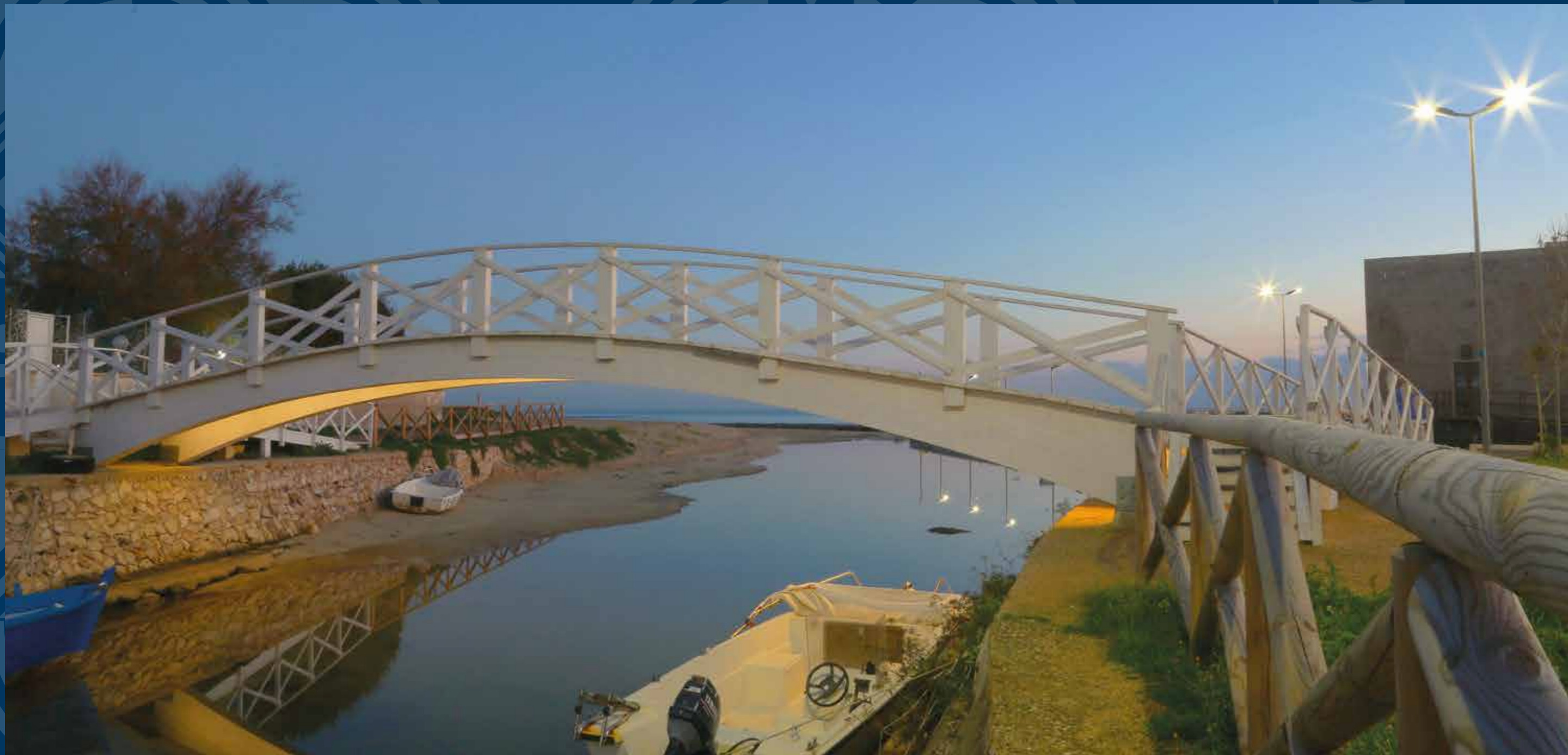
Torre Pali, marina di Salve - Ponte pedonale nei pressi del porticciolo