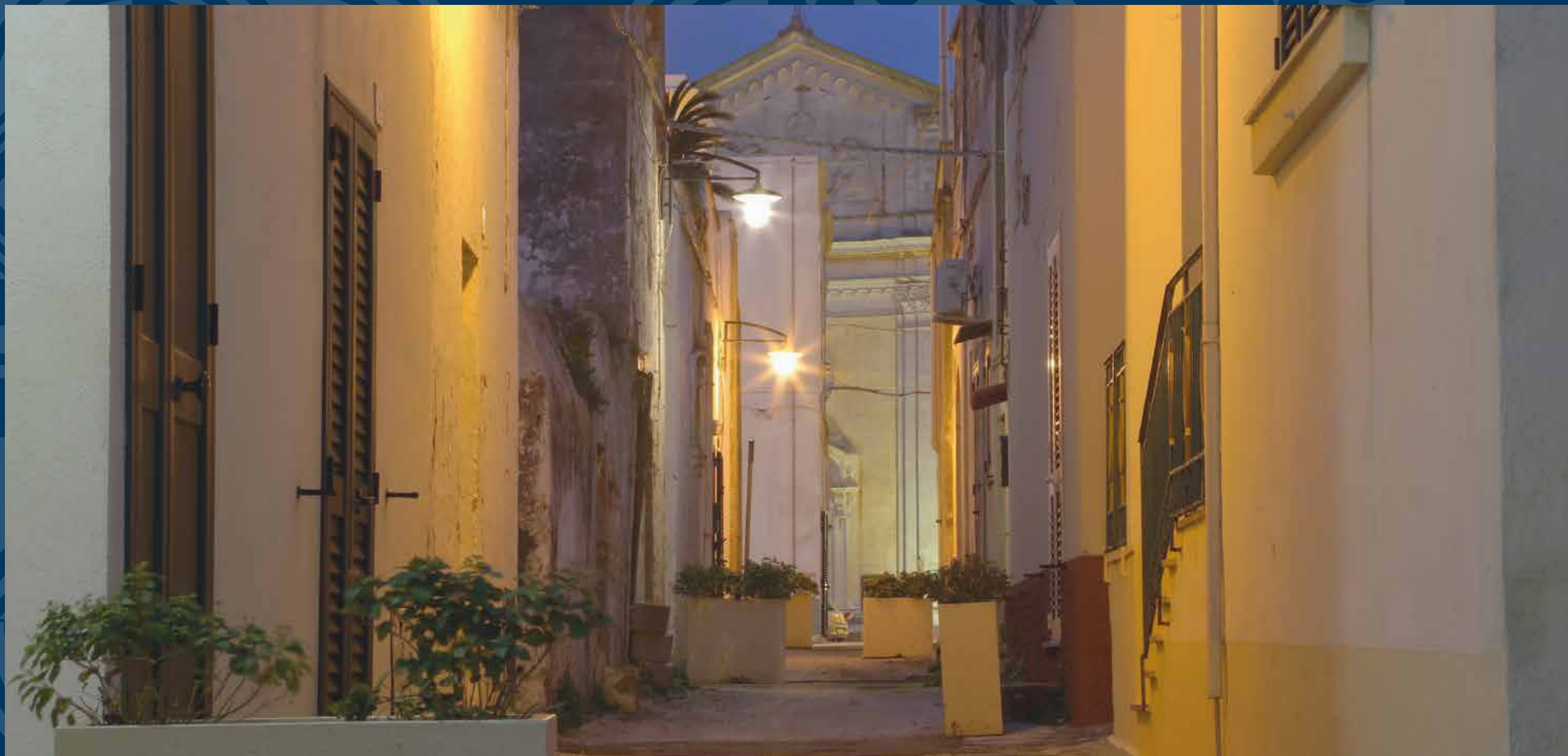
Centro antico di Salve - Vicolo del "rione terra" con veduta sulla facciata della Chiesa Madre San Nicola Magno