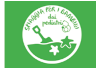
Bandiera Verde dal 2013