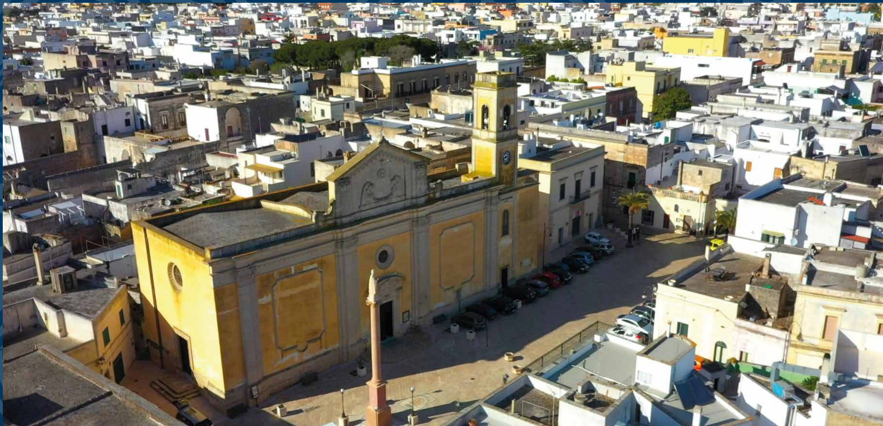
Salve, Piazza Concordia - Panoramica aerea con in primo piano la Chiesa Madre San Nicola Magno