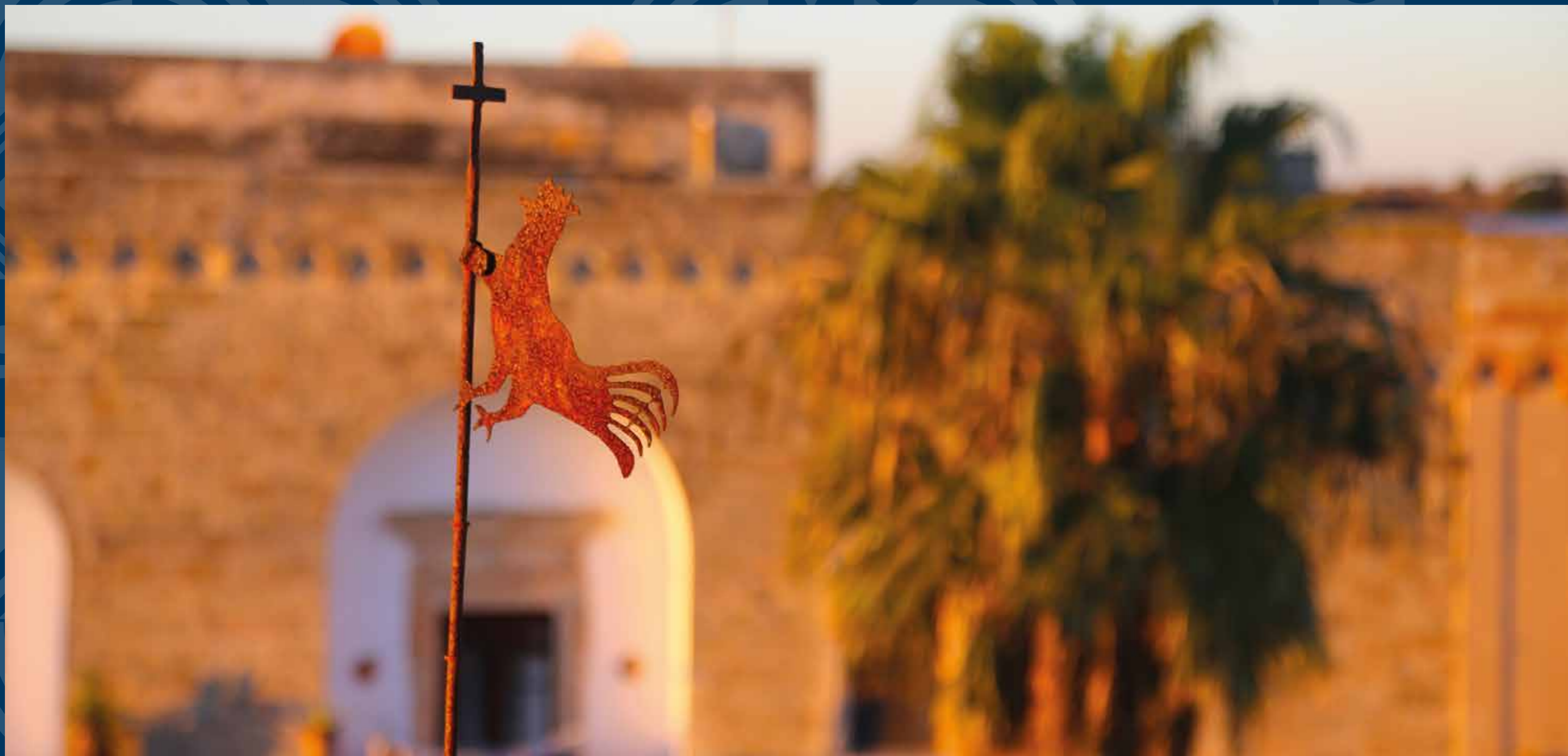
Ruggiano, frazione di Salve - Crocetta campanaria con gallo segnamento, uno degli ultimi frammenti della vecchia chiesa di Sant'Elia