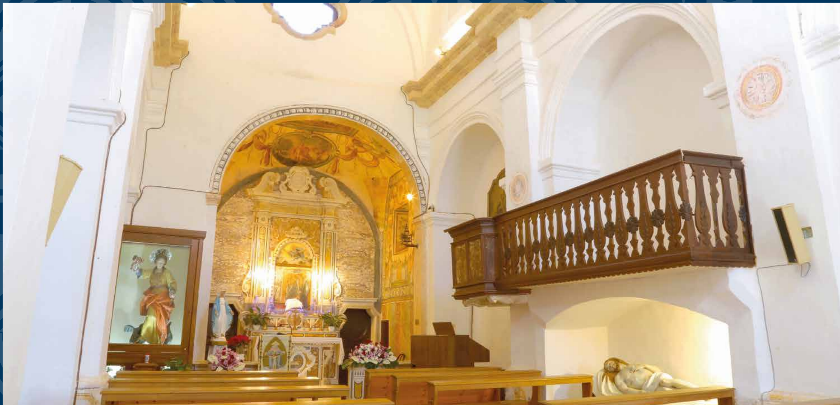
Ruggiano, frazione di Salve - Santuario di Santa Marina