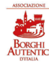
in associazione all'Unione dei Comuni "Terra di Lauca"