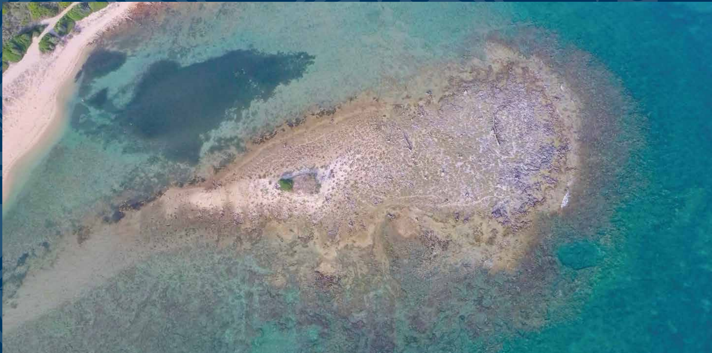
Torre Pali, marina di Salve - Vista aerea "Isola della Fanciulla"