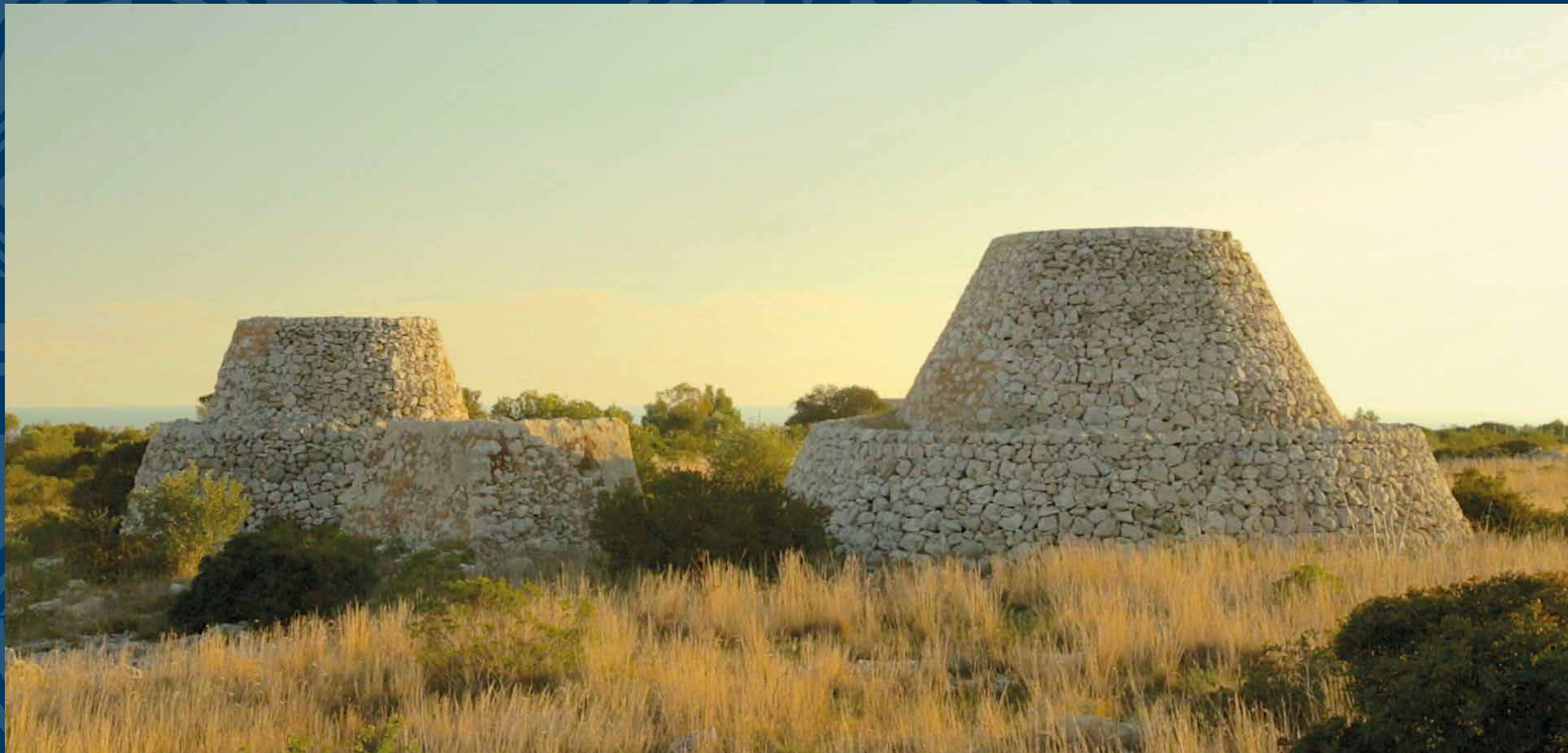
Coppia di "Pajare" nell'agro di Salve