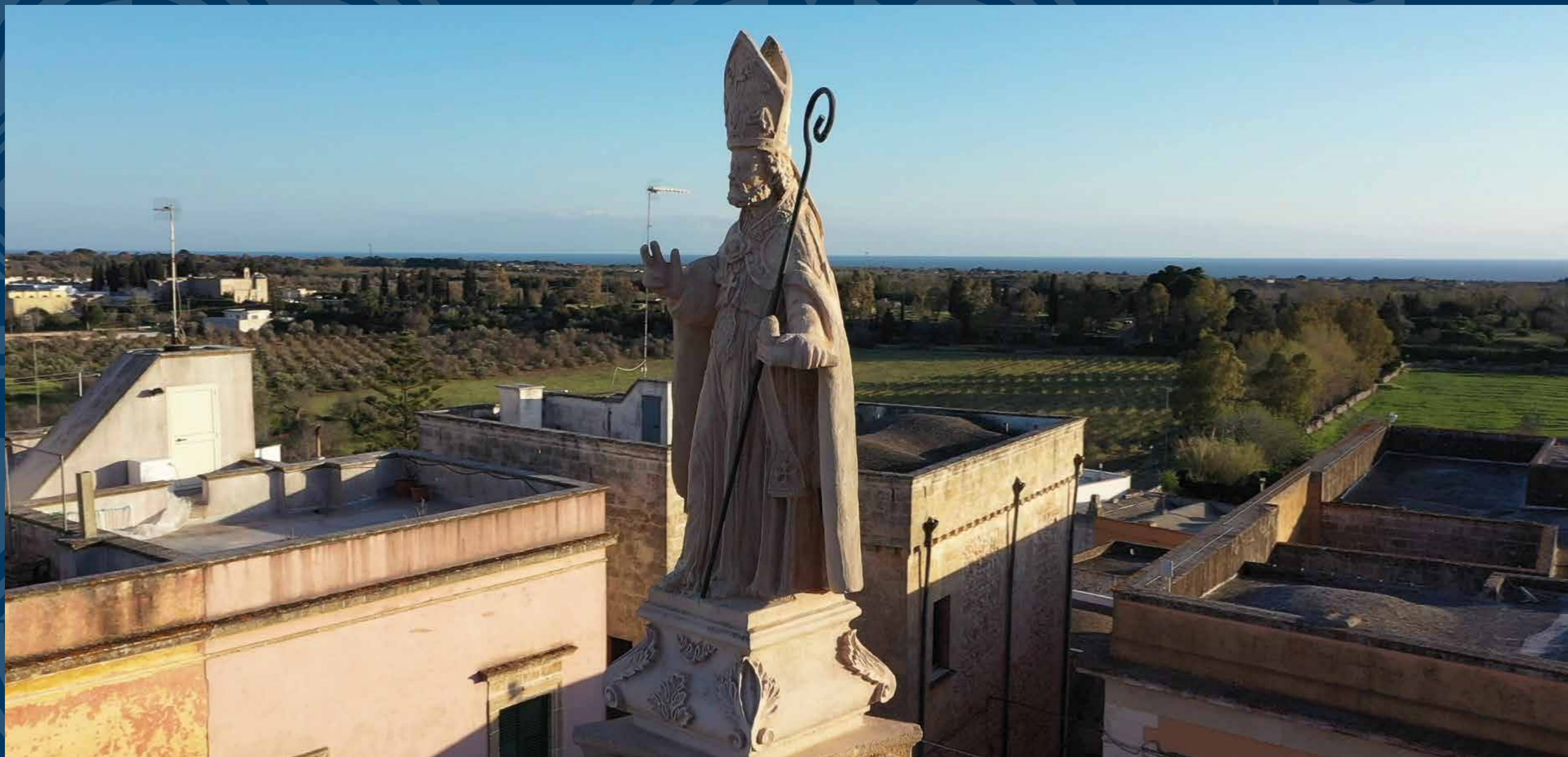
Salve, Piazza Concordia - Primo piano della statua di San Nicola Magno