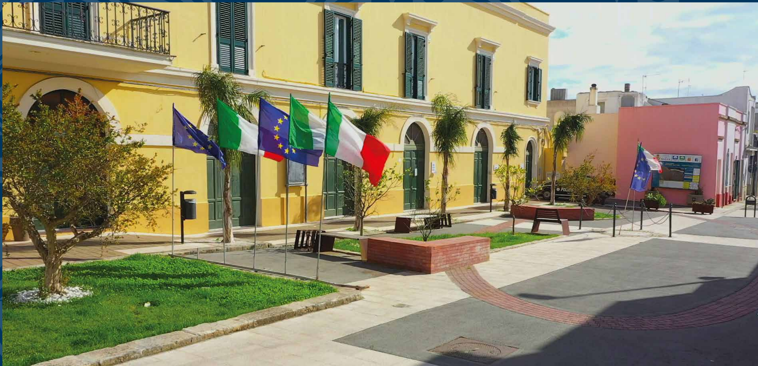
Salve, Piazza Renata Fonte - Sede Municipale