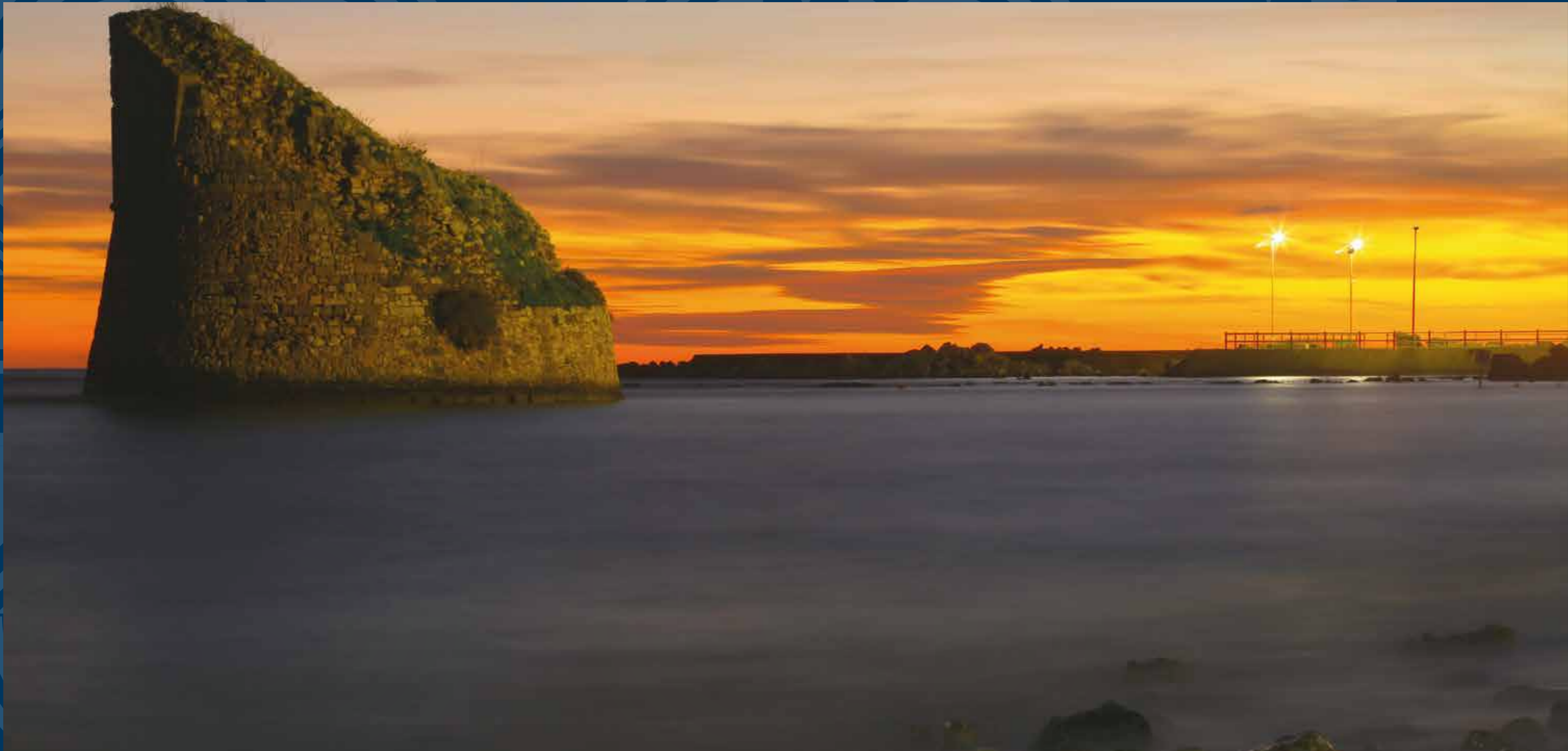
Torre Pali, marina di Salve - Torre di avvistamento costiera costruita nel XVI secolo