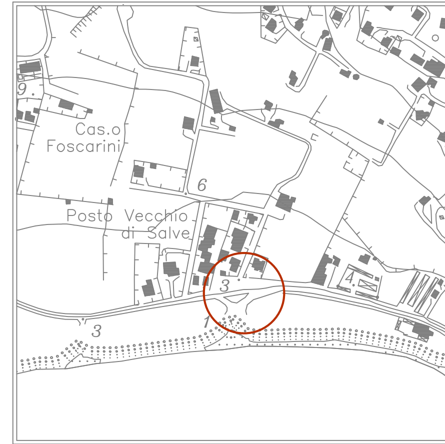
STRALCIO AEREOFOTOGRAMMETRICO — scala 1:5000 —