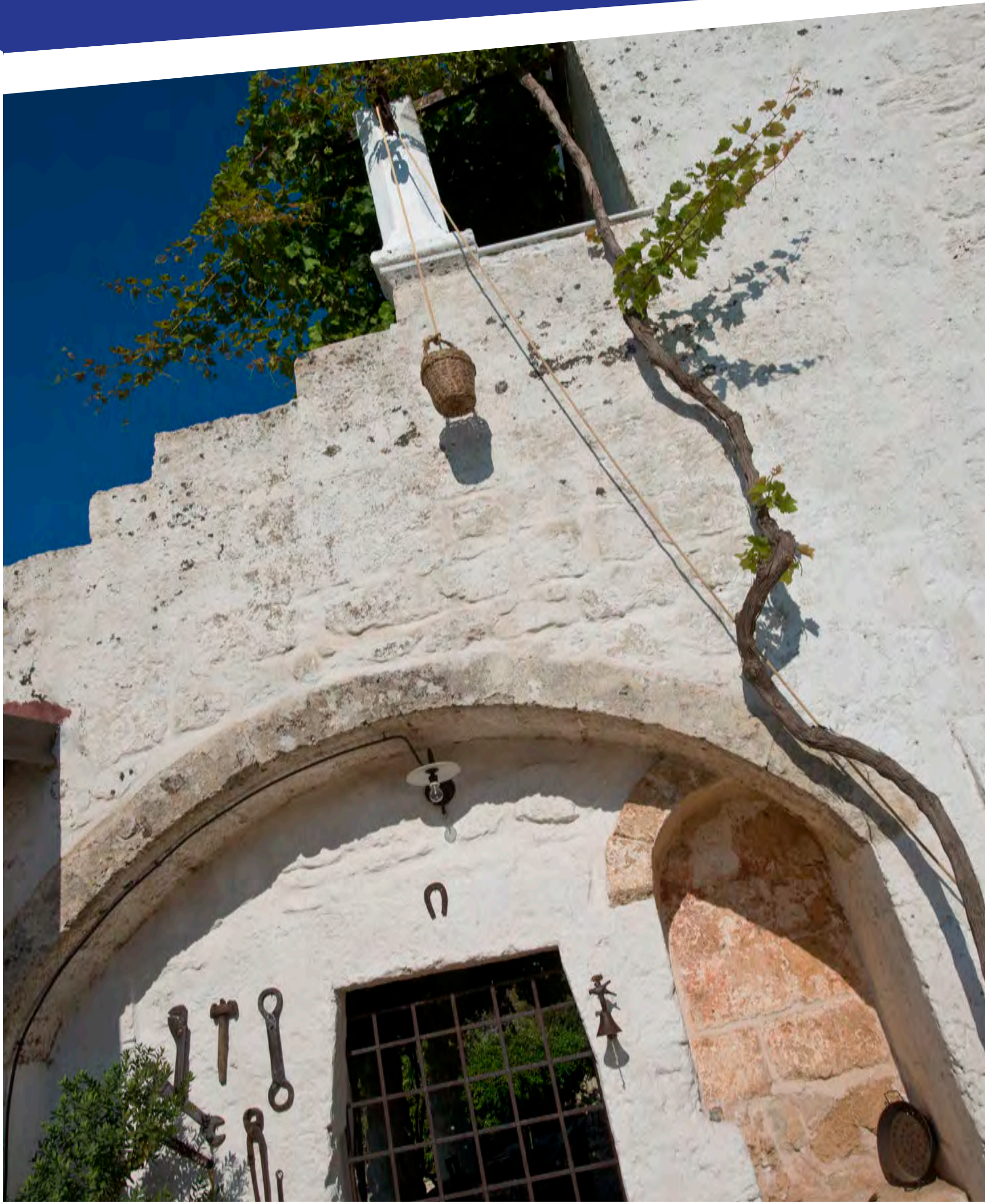
“Scorcio di Corte - Salve”

imposta di pubblicità a carico di chi lo espone al pubblico