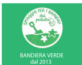
BANDIERA VERDE dal 2013