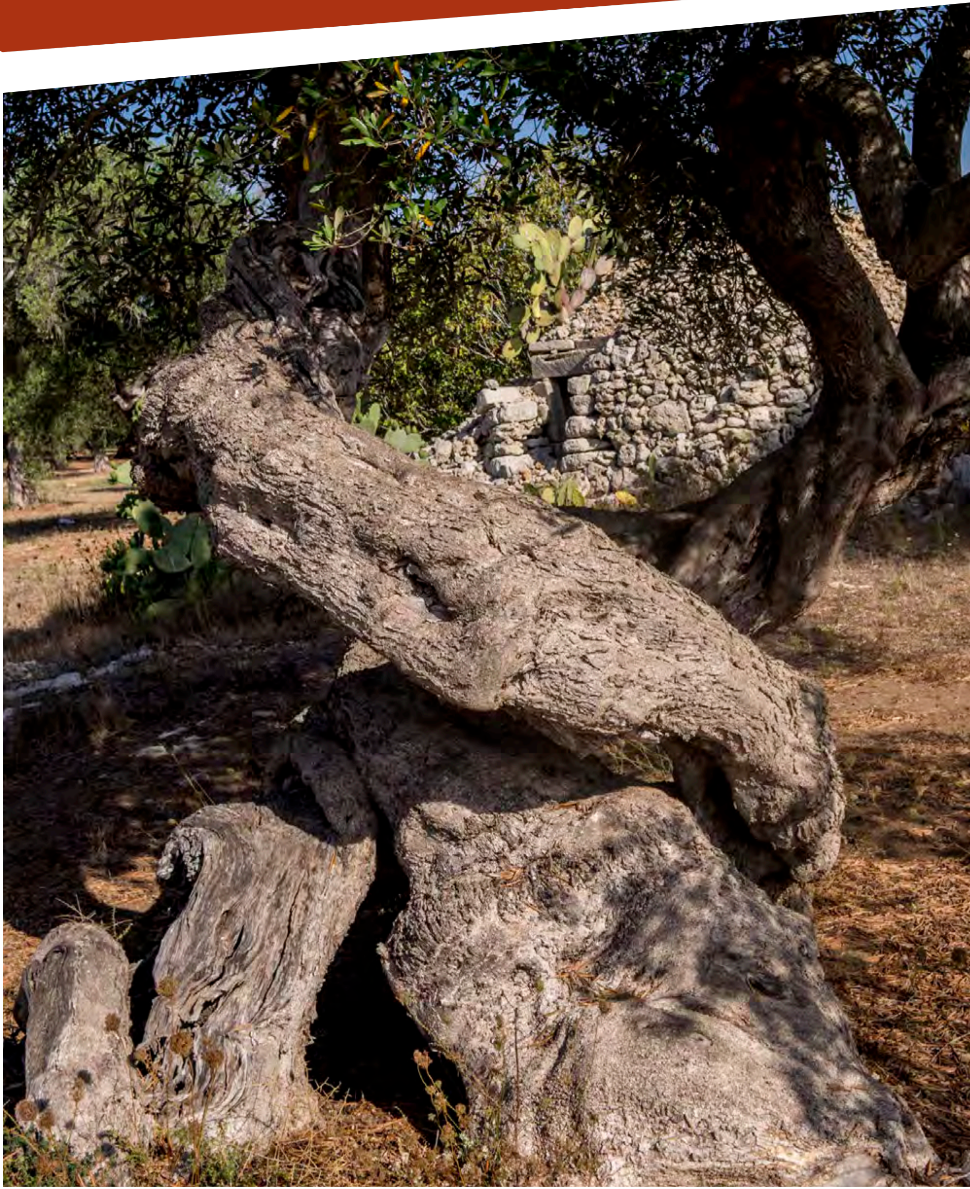
“Albero d'ulivo - Campagna di Salve”

imposta di pubblicità a carico di chi lo espone al pubblico