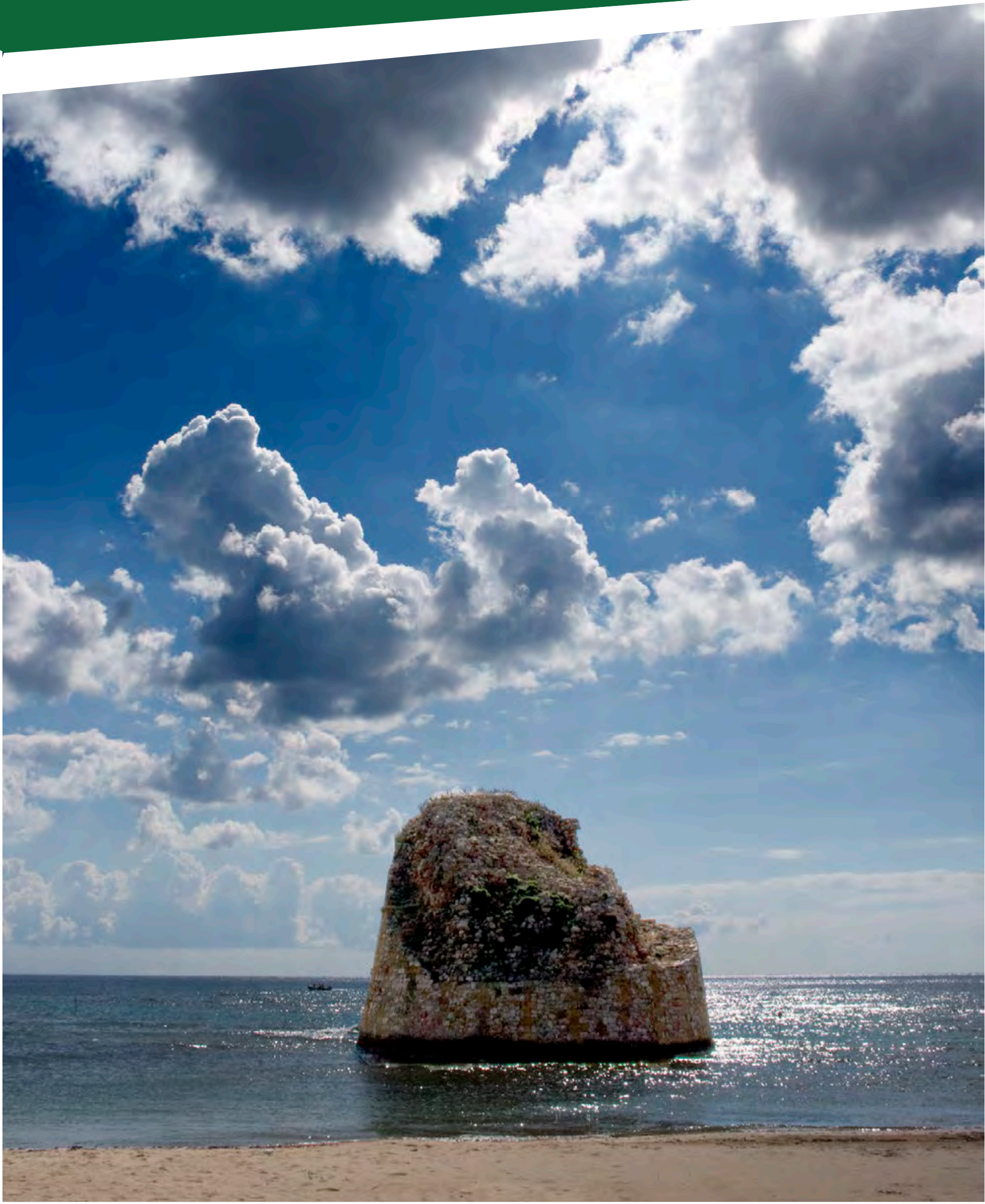
“Torre dei Pali - Marina di Torre Pali”

imposta di pubblicità a carico di chi lo espone al pubblico