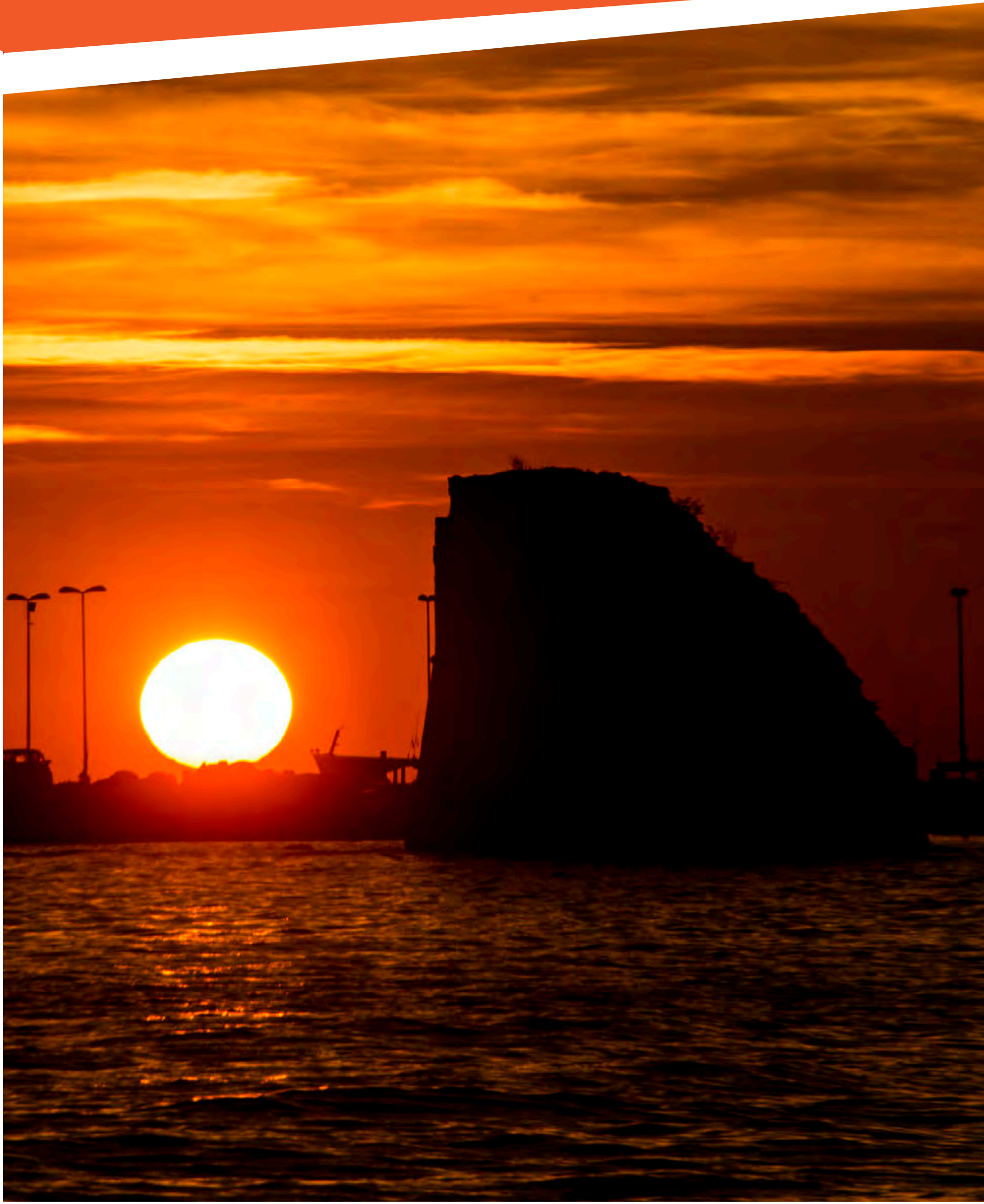
“Torre dei Pali - Marina di Torre Pali”

imposta di pubblicità a carico di chi lo espone al pubblico