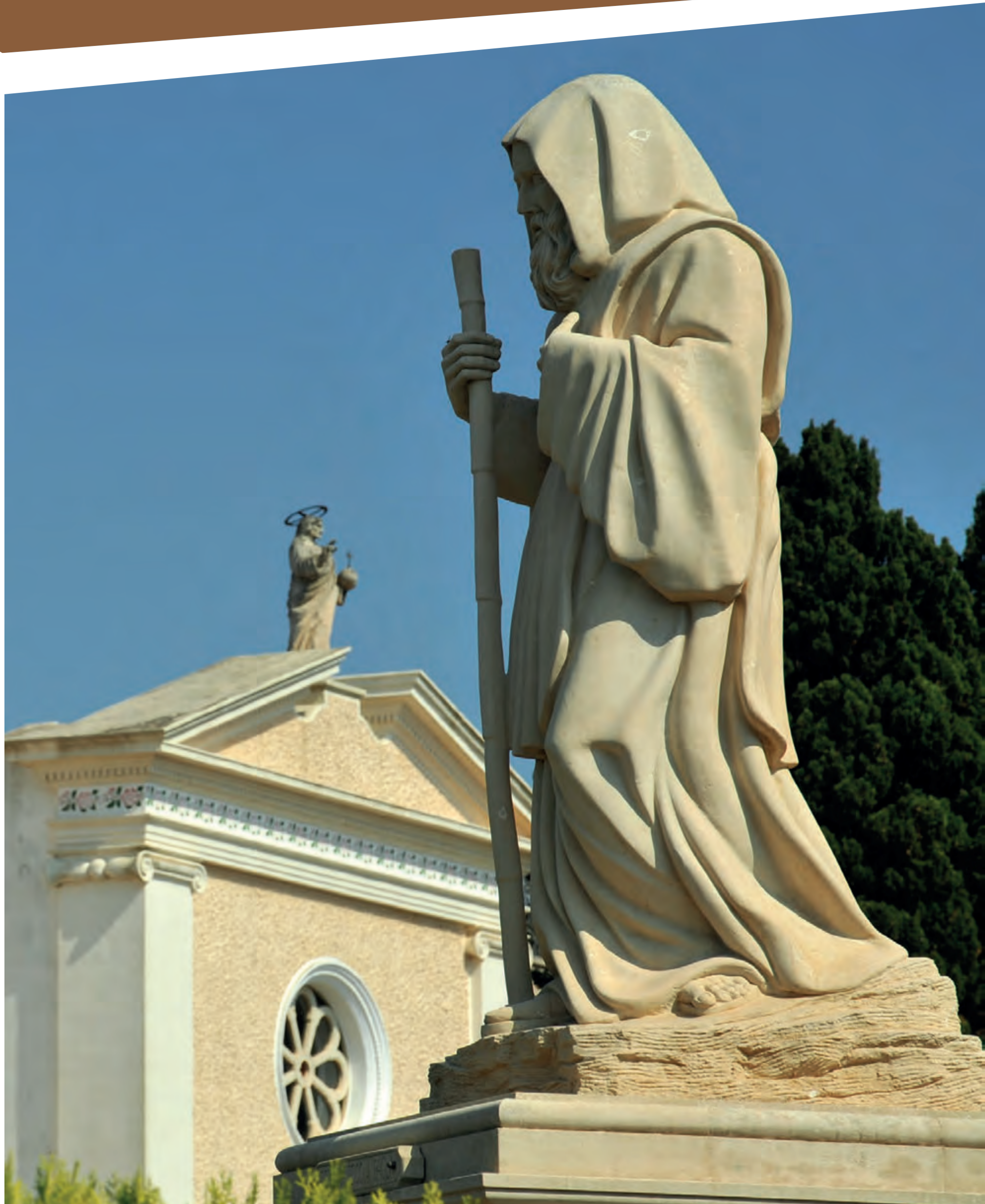
“Statua di San Francesco da Paola - Salve”

imposta di pubblicità a carico di chi lo espone al pubblico