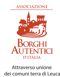
Attraverso unione dei comuni terra di Leuca