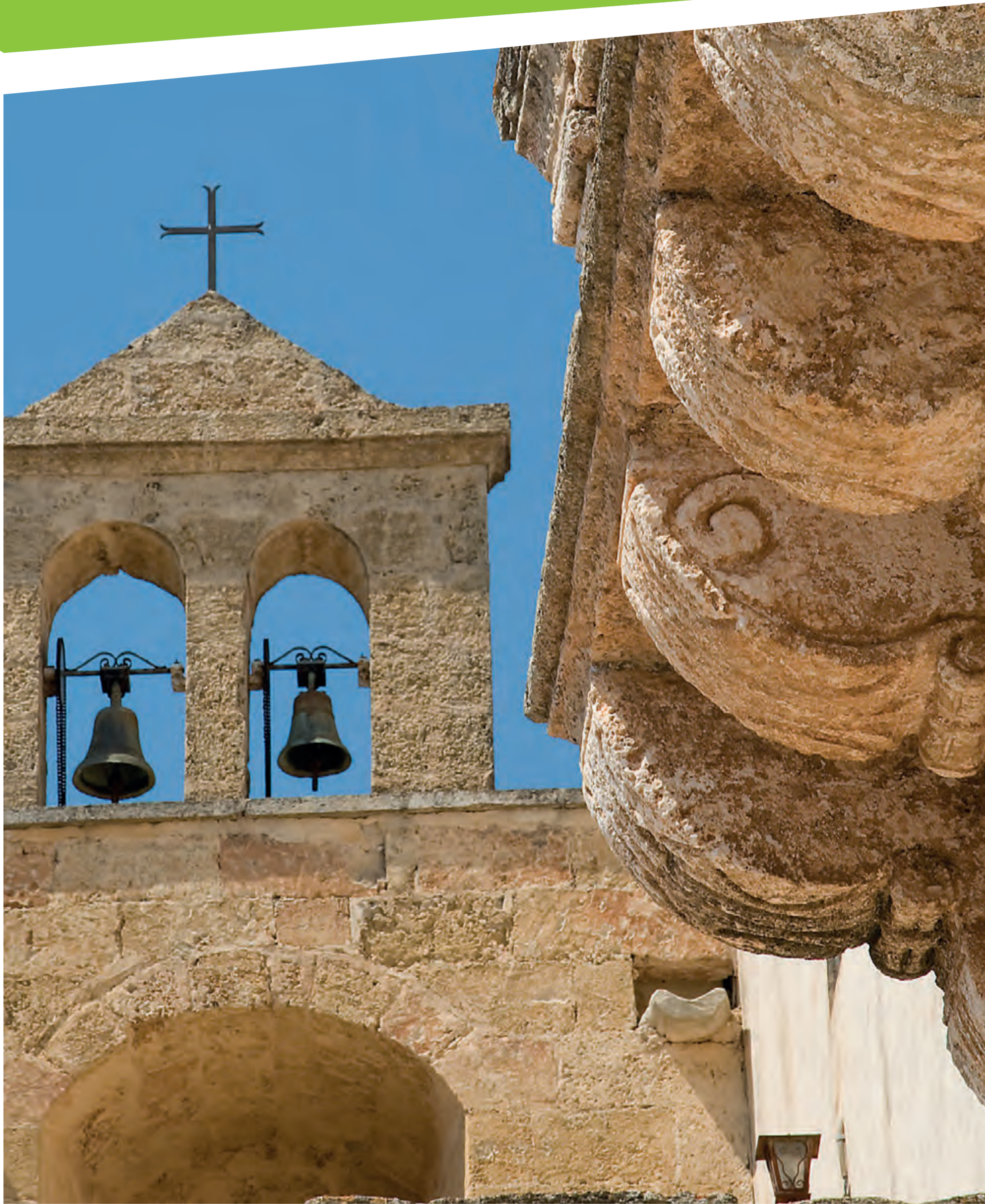
“Scorcio della Cappella di Santa Marina - Frazione Ruggiano”

imposta di pubblicità a carico di chi lo espone al pubblico