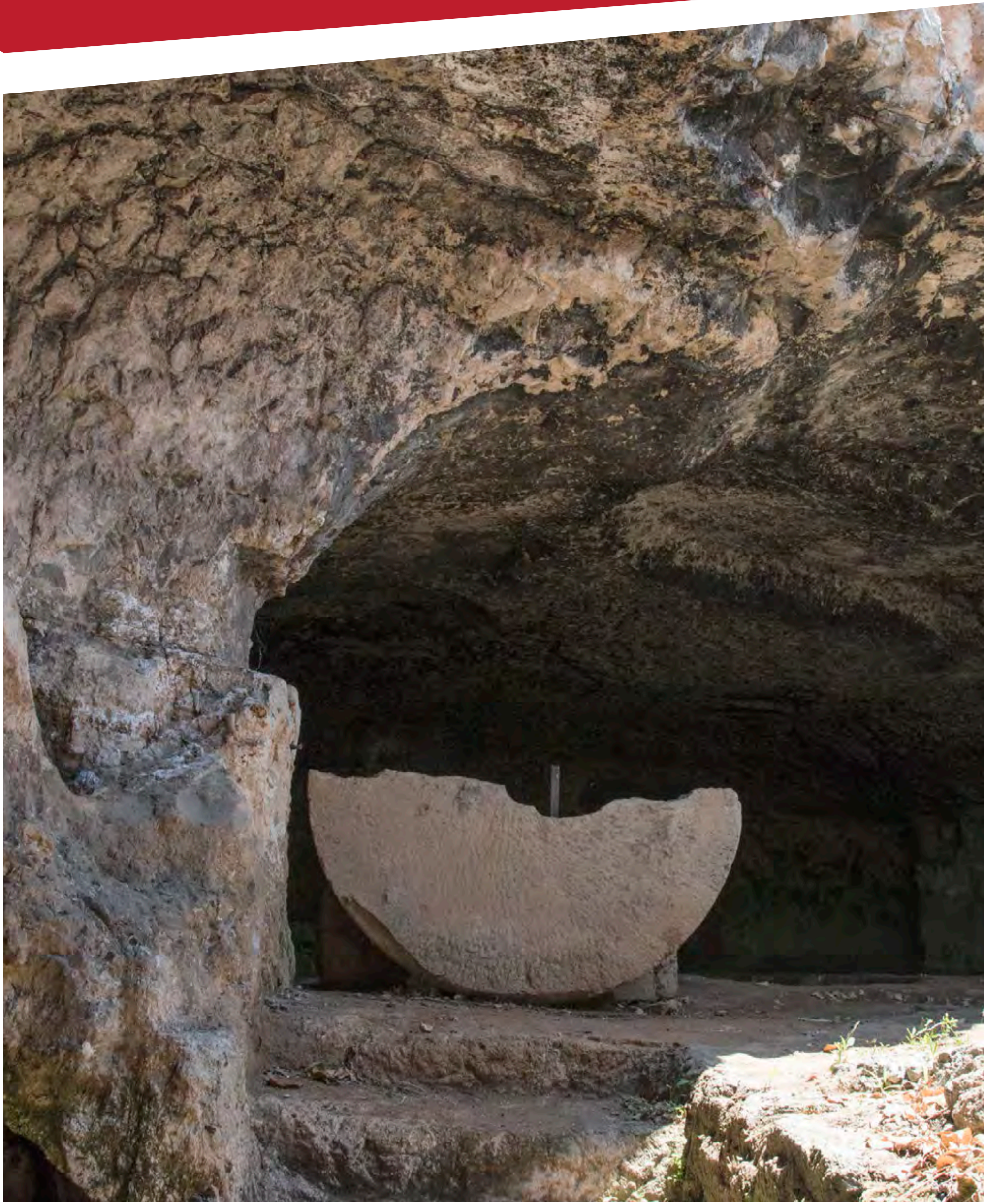
“Trappeto Ipogeo - Centro Antico di Salve”

imposta di pubblicità a carico di chi lo espone al pubblico