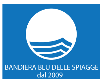
BANDIERA BLU DELLE SPIAGGE dal 2009