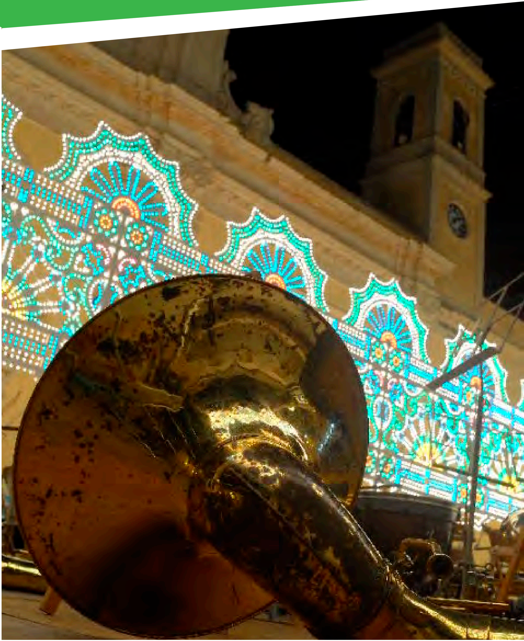
“Piazza Concordia - Centro Antico di Salve”

imposta di pubblicità a carico di chi lo espone al pubblico