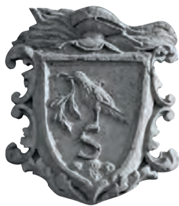
Comune di Salve