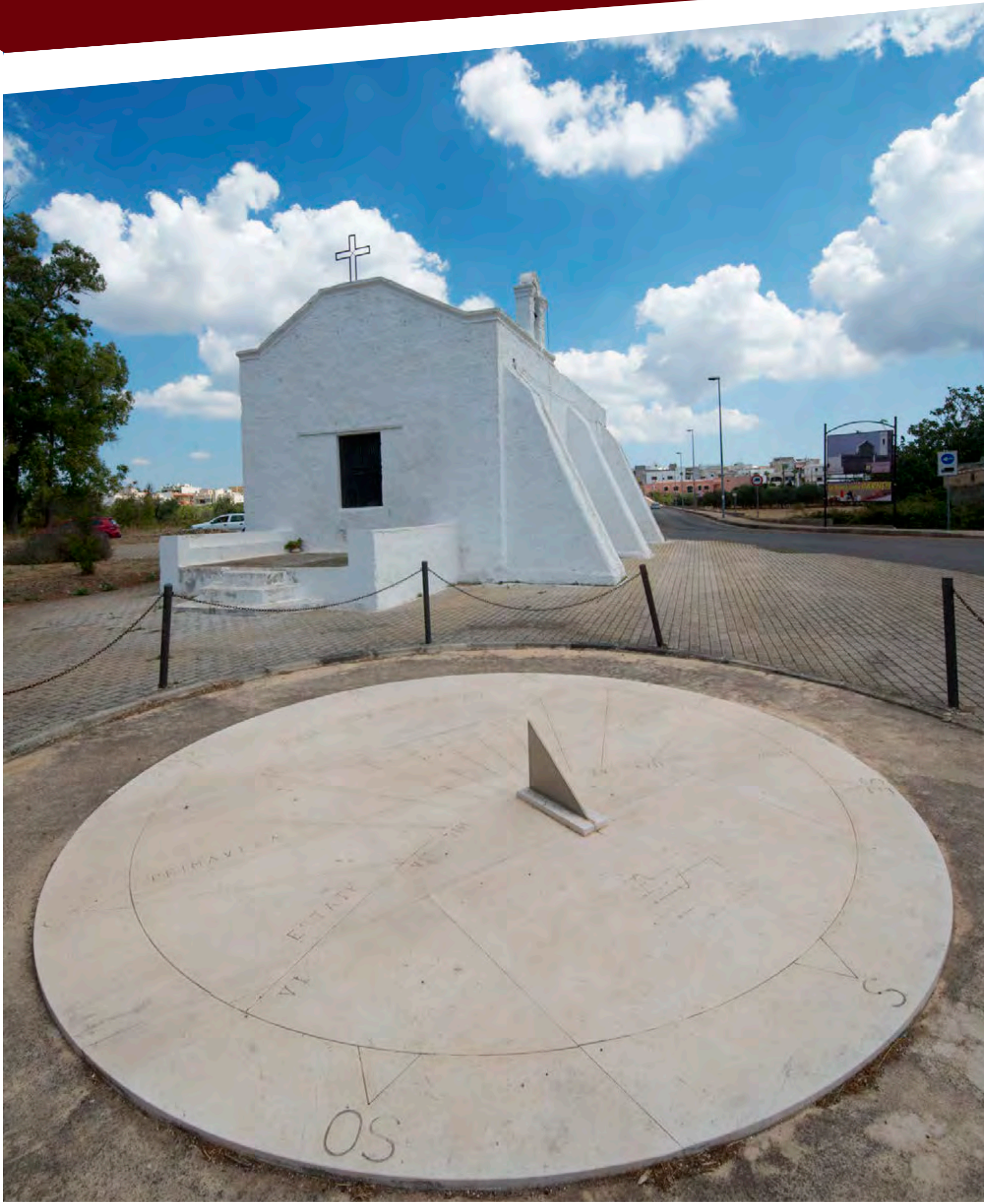
“Largo delle Fogge - Salve”

imposta di pubblicità a carico di chi lo espone al pubblico