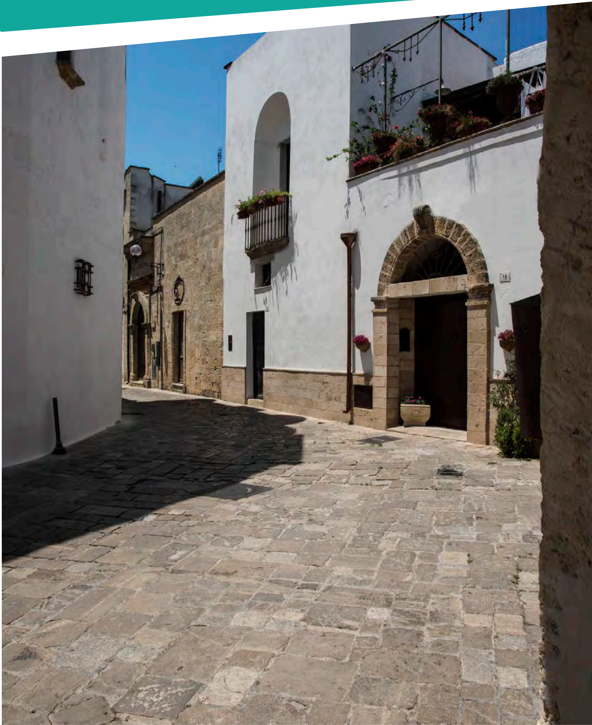
“Via Persico - Centro Antico di Salve”

imposta di pubblicità a carico di chi lo espone al pubblico