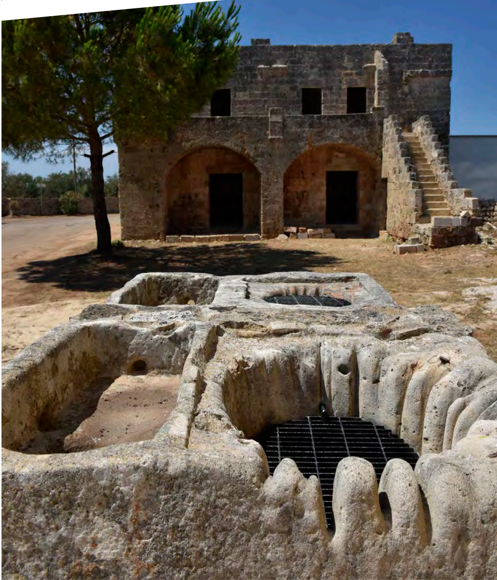
“Pozzo della Cappella di Santa Marina - Frazione Ruggiano”

imposta di pubblicità a carico di chi lo espone al pubblico