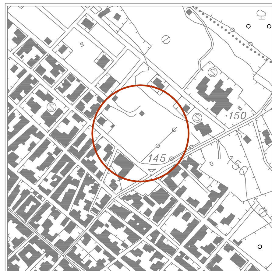
STRALCIO AEREOFOTOGRAMMETRICO — scala 1:5000 —