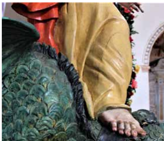
Foto 3. particolare disconnessione del legno