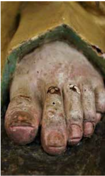
Foto 1. particolare in cui si evidenzia la presenza del tarlo

La superficie pittorica dell'opera risulta gravemente danneggiata, tarlata, ridipinta e ricoperta da uno spesso strato di polvere ( foto 1, 2, 3 )