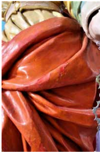
Foto 2. particolare di ridipintura sul manto e sull'incarnato