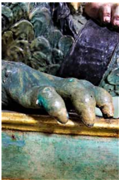
Foto 5 particolare di ridipintura

L'intera superficie è inoltre interessata dai numerosi tentativi di integrazione pittorica avvenuti nei precedenti restauri ( foto 5, 6 )