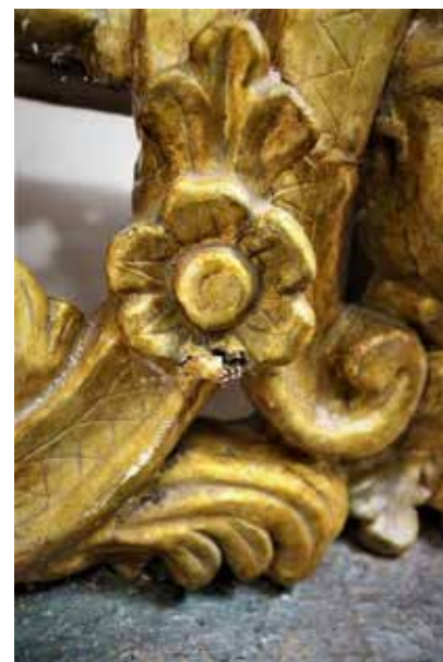
Foto 8, 9, 10 particolare rotture e mancanze del decoro