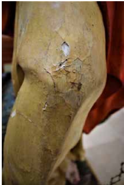
Foto 4 .particolare della crettatura del colore e delle lacune

Visibili sono le lacune e le crettature, con copiosa perdita di preparazione e film pittorico tanto da fare intravedere la sostanza legnosa ( foto 4 )