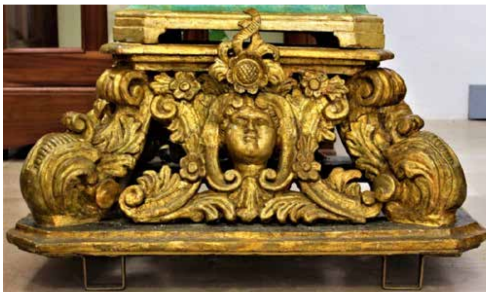
Foto 7. particolare appannamento doratura

Il basamento in legno è ricoperto da argento meccato, presenta modanature e fastigi con elementi di ispirazione floreale e antropomorfa e versa in un gravissimo stato di degrado, si osservano infatti spessi depositi di polvere sulle modanature ed un complessivo appannamento dell'originaria lucentezza della finitura dorata. Il legno mostra problemi strutturali causati dall'attacco di insetti xilofagi, numerose sono le interruzioni del disegno ornamentale ( foto 7, 8, 9, 10 ).