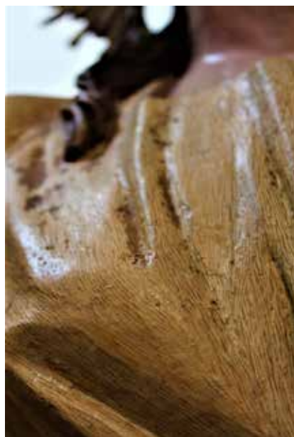
Foto 6.particolare di integrazione pittorica